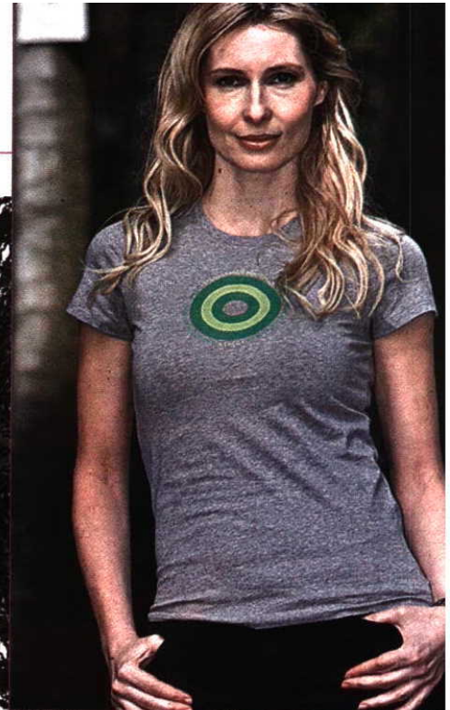
• Lúcia Moniz participou na sessão fotográfica da campanha "Cancro da Mama no Alvo da Moda"